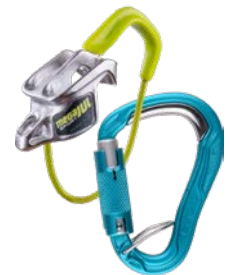
Mega Jul Sport Belay Kit Bulletproof Triple 73735