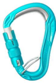
HMS Bulletproof Triple FG