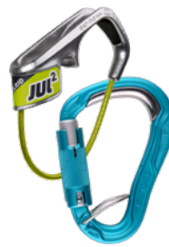
Jul 2 Belay Kit Bulletproof Triple 73732