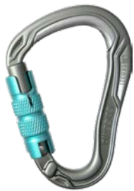
HMS Bulletproof Triple

Les lots concernés par l'appel à contrôle sont les lots 2018 01 et 2018 02 des deux modèles de mousquetons :