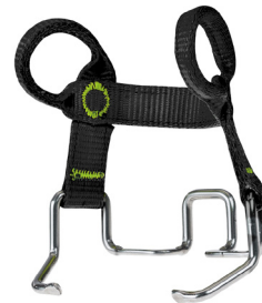
Crampon Binding Soft Back