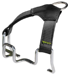
Crampon Binding Soft Front

EDELRID ruft die Besitzer von Steigeisen-Softbindungen auf, die richtige Kombination der Bauteile zu überprüfen.