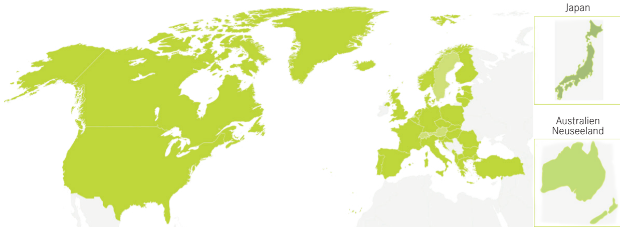
EDELRID AUTHORITIES Vertriebsländer in Europa Kartenansicht: